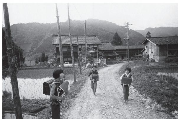
〈いつか見た風景〉より《やまばの里》新潟県青海町 1975年

〈抵抗〉、〈三里塚〉、〈いつか見た風景〉、〈村へ〉、〈1973年中国〉、〈新世界物語〉、〈おてんき〉、〈ライカで散歩〉ほか合計約300点