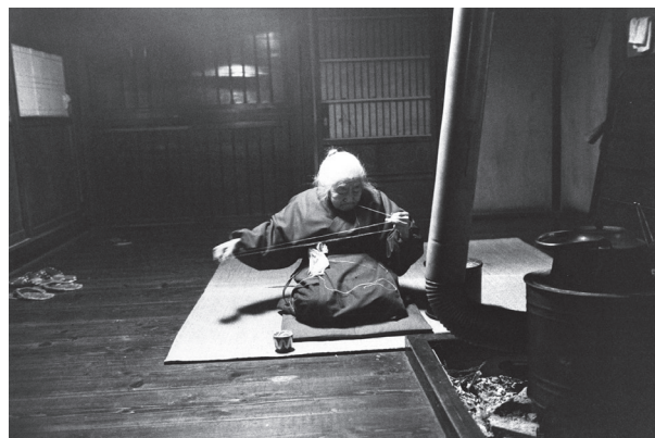
〈村へ〉より《学績・おうみ》新潟県塩沢町 1976年 表面: 〈村へ〉より《お盆》岡山県久米町 1974年