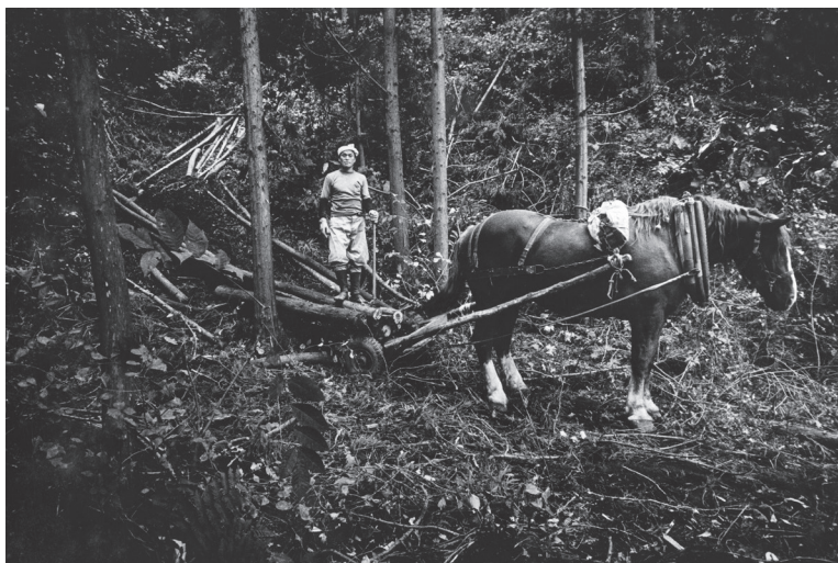
〈村へ〉より《馬方》宮城県石巻市 1973年