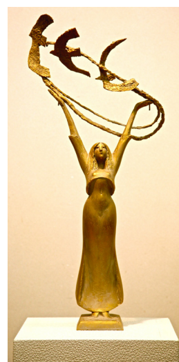
日高頼子 大空へ 2015年