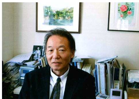
長岡市で主宰するギャラリー「創」にて

水彩の透明感と爽やかさ、油彩の落ち着きと重量感、どちらも私にとっては魅力的で、結局、両方を楽しんでいます。描くときのプロセスの違いから、頭の切り替えが必要となりますが、むしろそのときが脳のリフレッシュタイムのような気がします。 その作品の狙い、モチーフの見せ方、全体の色調、もろもろ熟慮のうえ制作に入りますが、途中からそのもろもろが脆くも崩れ去る、そんなことは茶飯事です。そんなことも絵を描く楽しさの一要素なのかも知れません。 さて、私は「創」というギャラリーを主宰しておりますが、多彩な作家の作品を企画展示し、多くの美術愛好家の皆さんに鑑賞していただく橋渡し役も、私の「楽しむ」につながっているように思います。 次の楽しみのために、今度の一筆はどんな色を取り、どこに置くのか、私自身、大変興味深く、楽しみではあります。